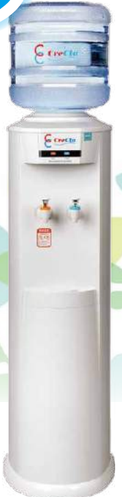
クリクラサーバーL 外形寸法 幅305×奥350×高990mm