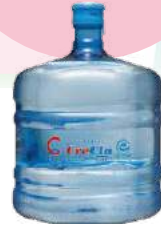
クリクラボトル 外形寸法 幅270×高378mm