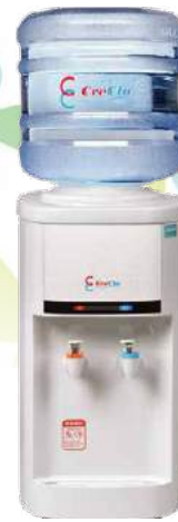
クリクラサーバーS 外形寸法 幅270×奥460×高510mm